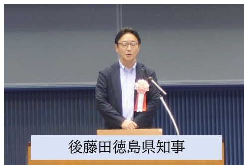
後藤田徳島県知事