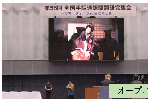
オープニングアクト