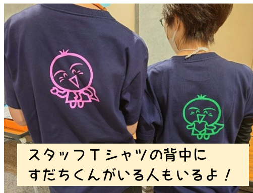
スタッフTシャツの背中に すだちくんがいる人もいるよ！