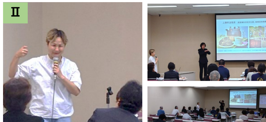
匿名希望 (聴者・30代)