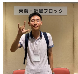
匿名希望 (ろう・愛知県・30代)

一番印象に残ったのは、記念講演で特に核についての話でした。核戦争によって日本は2時間でダメになるということはかなり衝撃でした。